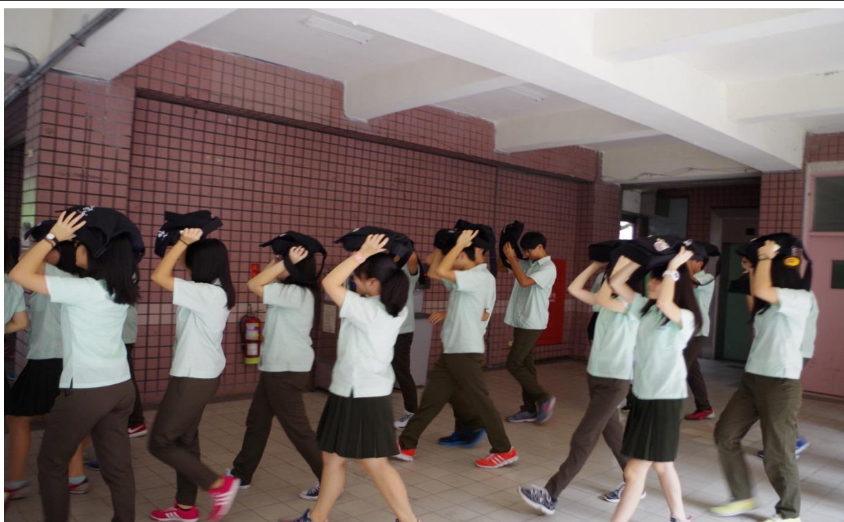
教室疏散-頭部保護