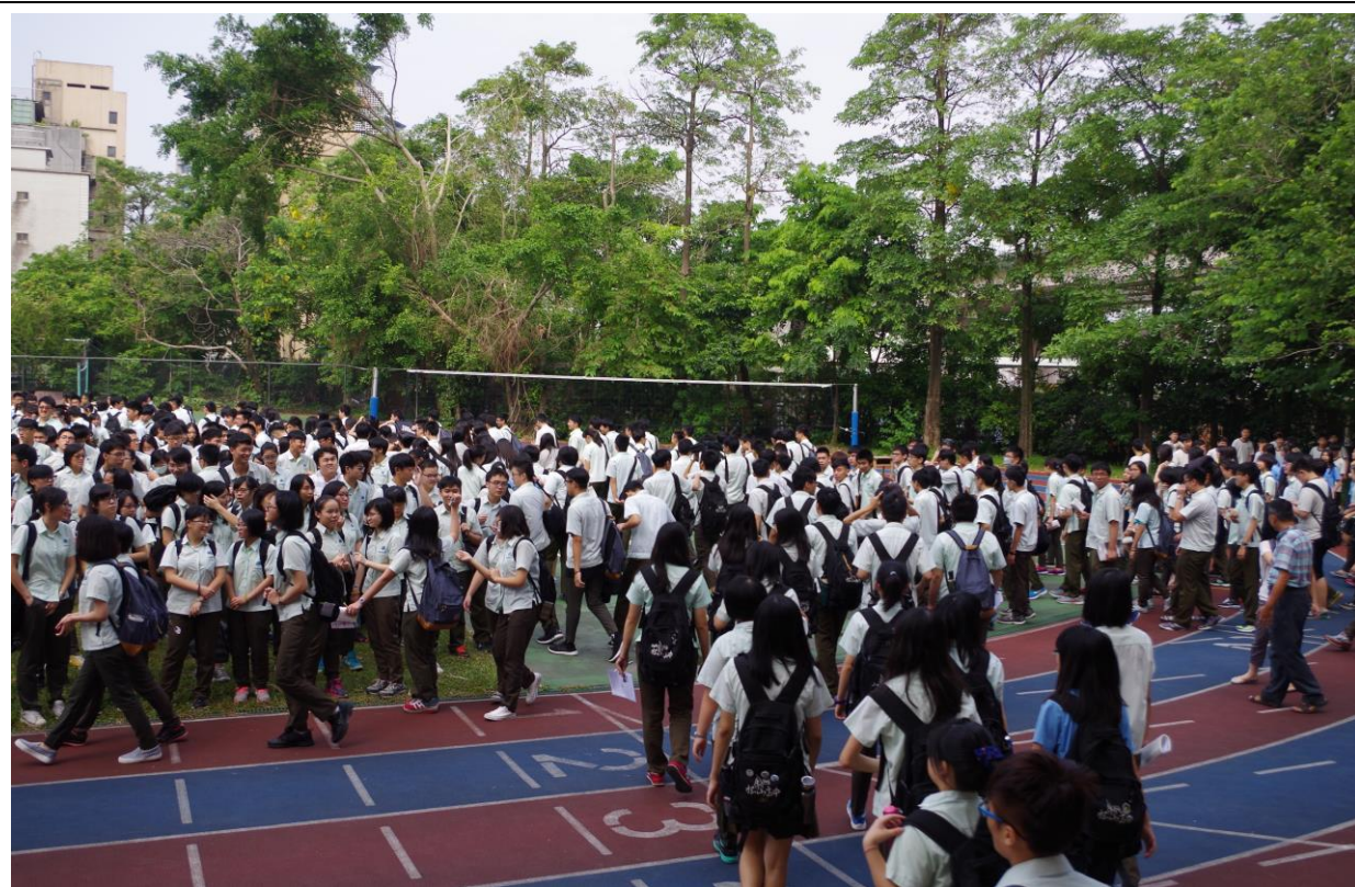
教室疏散-往操場集合