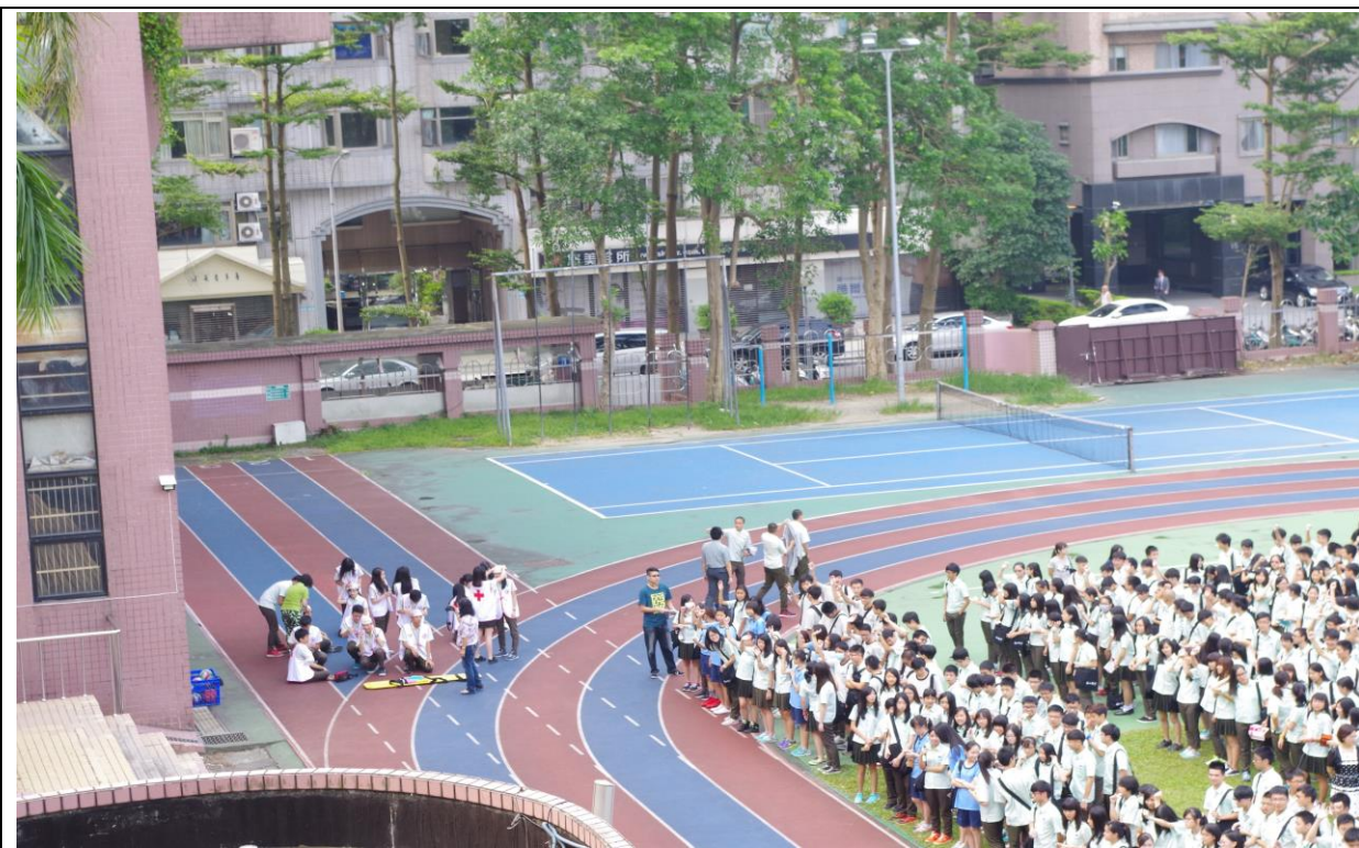
紅十字會服務隊操場實施受傷人員處置作為