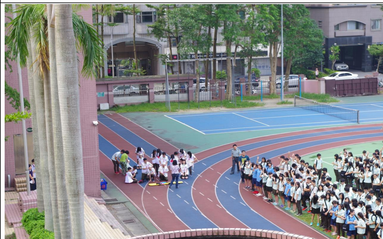
紅十字會服務隊操場實施受傷人員處置作為