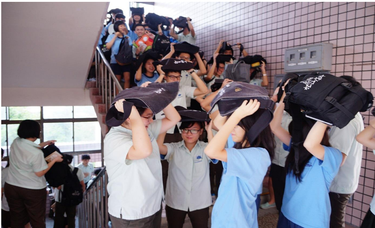
教室疏散-頭部保護