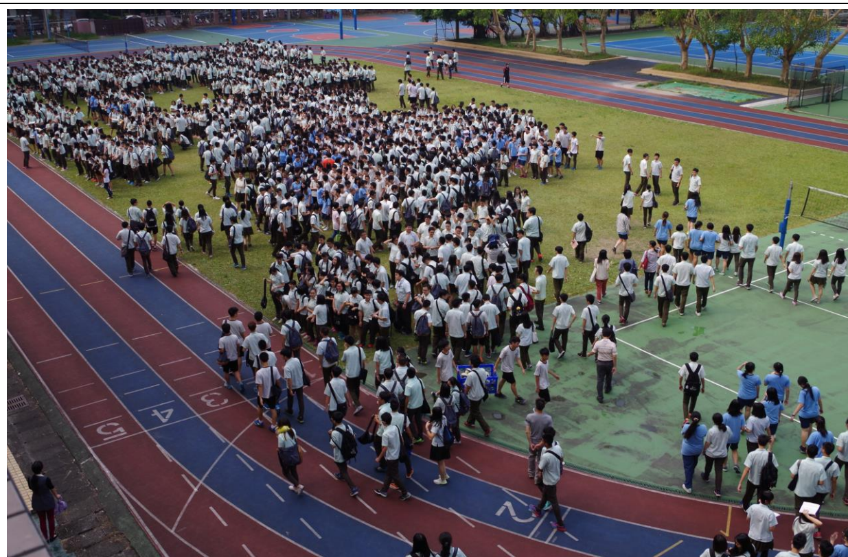
教室疏散-往操場集合